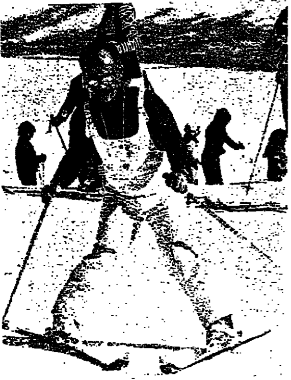
الملك حسين قبل عودته من سان موريتز